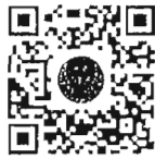
หนังสือนัดประชุม และระเบียบวาระการประชุม สภาผู้แทนราษฎร

การนัดประชุมได้แจ้งให้สมาชิกทราบทางสื่ออิเล็กทรอนิกส์เรียบร้อยแล้ว และท่านสมาชิกสามารถอ่านเอกสารประกอบการประชุมสภาผู้แทนราษฎรได้ โดยการสแกน QR Code หรือทาง www.parliament.go.th